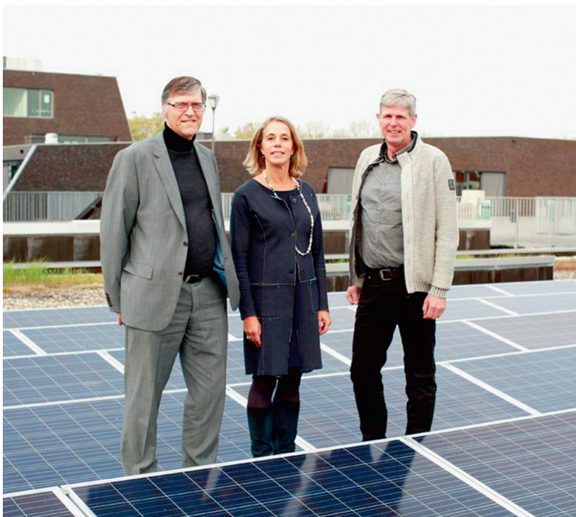
Het Sterren College is één van de tien scholen van Dunamare Onderwijsgroep die nu zelf zonne-energie opwekken.

“Daarom kiezen we eerst voor investeren in het laaghangende fruit, zoals goede isolatie en zonnepanelen. Met beperkte middelen kun je veel bereiken. Veel kleine beetjes op verschillende plekken zorgt bij elkaar voor een grote energiewinst.” ■